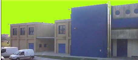
PALACUS - via delle Scienze, 100

da qualsiasi punto cercare e seguire le indicazioni per l'ospedale civile Santa Maria della Misericordia di Udine, lasciando l'ingresso principale sulla destra proseguire lungo via Gino Pieri, non salire sul cavalcavia ma rimanere sulla destra, alla rotatoria imboccare via Cottonificio, per poi svoltare sulla sinistra in via delle Scienze, al numero 100 troverete il